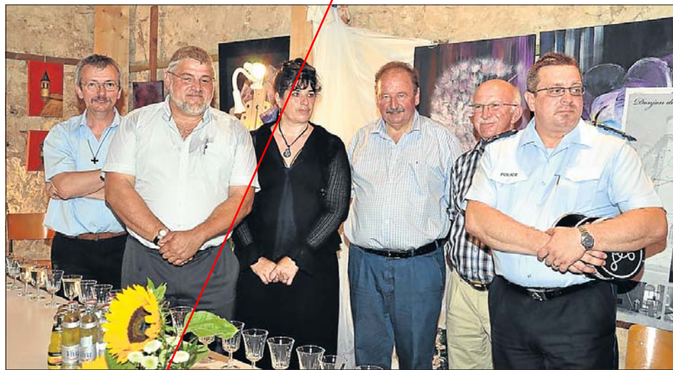
Mit einer Kunstaussstellung wurde das 27. „Schlassfest“ am Samstag eröffnet.

Kunstaussstellung als Auftakt des „Schëndelser Schlassfest“