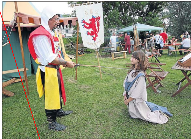
Als Belohnung für ihre Teilnahme an mittelalterlichen Spielen erhielten die Kinder zum Schluss den Ritterschlag.

Am vergangenen Freitag wurde Hesperingen für drei Tage ins Mittelalter zurückversetzt. Bis zum Sonntag fand dort auf dem Urbingschloss-Platz ein historischer Markt mit einem umfangreichen Kulturprogramm statt.